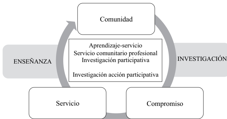
FIGURA 1.2. Participación del trabajo docente en y con la comunidad (Fuente: adaptada de Thomson et al. (2011), como se cita en Opazo et al. , 2019, p. 20).

Este libro quiere dar respuesta a algunas de las cuestiones que se nos han planteado, reflexionando sobre el ApS como método para crear propuestas inclusivas que se relacionen con la neurodiversidad de nuestro alumnado, así como resaltar la importancia de integrarlo en propuestas DUA, ya que, como plantea Sánchez-Mendías (2024), no es fácil lograr la inclusión por las dificultades del propio sistema, y las estrategias que llevan al DUA pueden mejorar los procesos de aprendizaje de los estudiantes. El objetivo del proyecto es incrementar la investigación y el análisis de la metodología de ApS, a través de la reflexión de propuestas puestas en práctica en el aula universitaria.