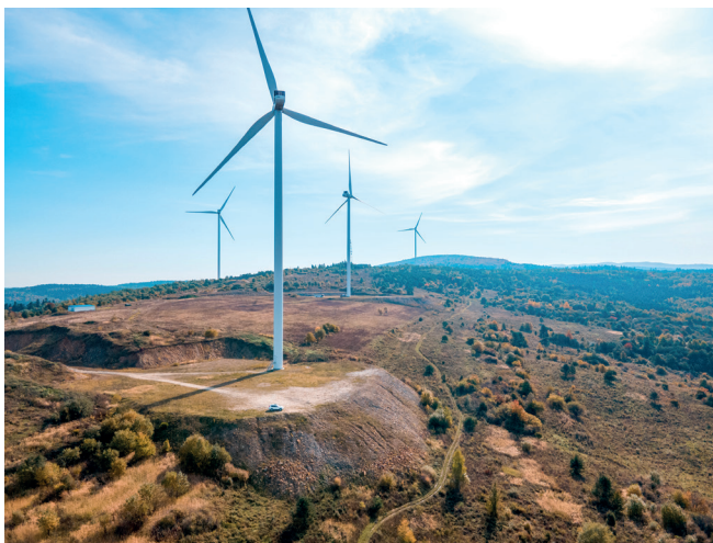
Figura 2.2 Infraestructuras de un parque eólico

Las vías de acceso para la instalación de los aerogeneradores deben presentar unas dimensiones que permitan transitar a los camiones de transporte con las grandes piezas que los componen (figura 2.2), por lo que se deben construir las curvas con grandes radios de giro. La creación de dichos accesos supone destrucción del hábitat natural, desaparición de vegetación, ruido y modificaciones en el comportamiento de la fauna. Se debe tener en cuenta el consumo energético derivado de la fabricación de los materiales y su transporte, así como de la instalación de los aerogeneradores (principalmente vías de acceso e instalación en la localización proyectada). Esta etapa de instalación incluye la preparación en el sitio: cimentación, izado de las turbinas y conexión a la red, lo que deriva en el consumo de recursos y la generación de residuos.