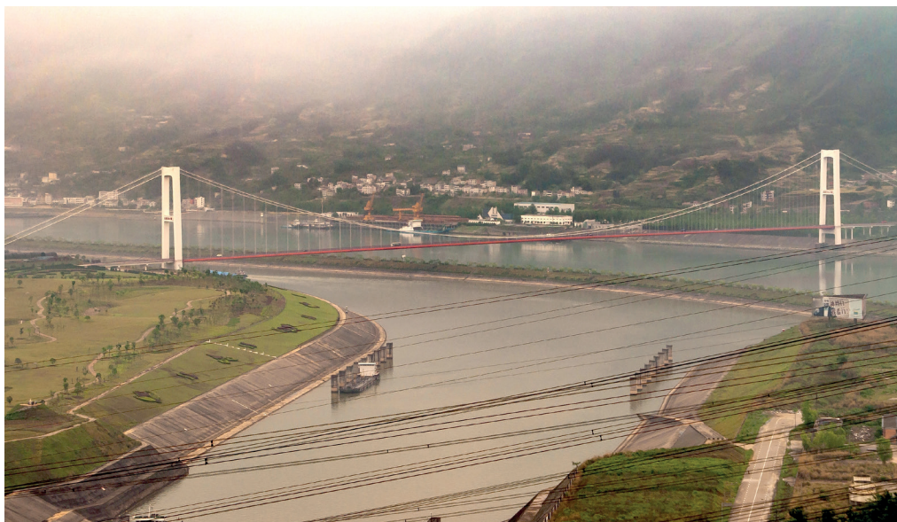
Figura 2.1 Viaducto construido sobre un embalse

La construcción de embalses (figura 2.1) afecta al hábitat por diferentes motivos: su instalación implica grandes excavaciones y modificaciones de caudales naturales e incluso del propio curso del río.