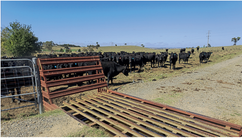
Figura 2.6 Paso canadiense

Los pasos canadienses son instalaciones con rejas en su parte superior que permiten el paso de vehículos por ellas, pero no de fauna de gran tamaño, de manera que se compatibilizan la circulación de vehículos y personas y el confinamiento de este tipo de fauna. Con su instalación se evita el paso de los animales a los viales.