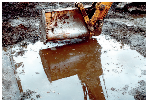
Figura 2.5 Vertido generado por maquinaria de obras

En el momento en que la nieve se funde, la presencia de dicho elemento en el suelo supone una disminución tanto de la capacidad de absorción de nutrientes como de la permeabilidad. Por otro lado, recientes estudios destacan que las sales utilizadas por los equipos de mantenimiento de carreteras presentan altas concentraciones de microplásticos.