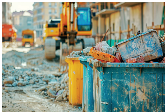
Figura 2.4 Contenedor de residuos

Se generan residuos en todos los trabajos que se realizan, ya sean originados por las propias labores de construcción y posterior conservación (embalajes, cambios de aceites) o por el tráfico. Debido a ello es necesaria la construcción de un centro de conservación, que tendrá las funciones de centro de operaciones, taller y parque de residuos (figura 2.4).