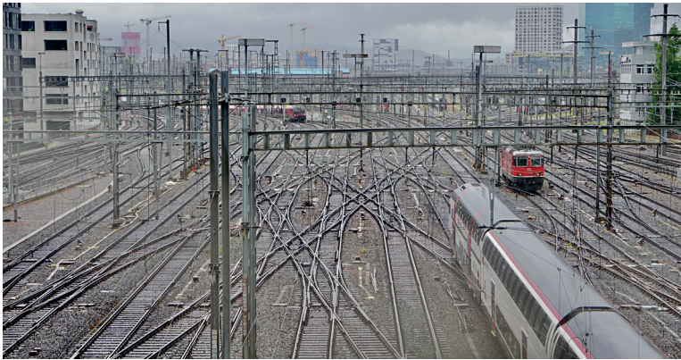
Figura 2.3 Infraestructura ferroviaria

También supone el uso de materiales prefabricados, como los pretensados y los materiales plásticos en las canalizaciones y los drenajes. Por último, el uso de sustancias bituminosas y aglutinantes supone la distribución sobre el terreno de sustancias químicas potencialmente contaminantes.