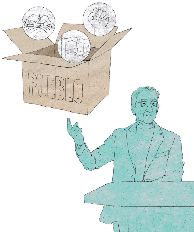
Figura 2.2. Manosear los términos.

Para algunas personas, “libertad” puede representar independencia personal. Para otras puede significar la existencia de condiciones sociales y políticas de ausencia de restricciones (¿tomar cañas en una terraza al aire libre?). Tampoco es lo mismo utilizar la libertad para operar en un mercado que referirse a ella como política asociada con los derechos civiles y la lucha por una sociedad justa y sin opresiones.