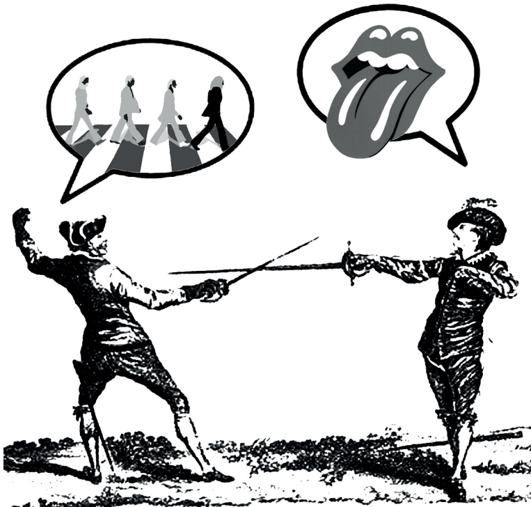
Figura 2.1. De los labios a los colmillos: el lenguaje del conflicto.

La política destemplada recurre con frecuencia a un término de origen gaélico, “eslogan”, que significaba “grito de guerra” y era la invocación a las armas de un clan escocés. Como ilustra la figura 2.1, cuando no somos capaces de resolver los conflictos meneando los labios, acabamos por enseñar los dientes. En realidad, dividir es el truco más antiguo de la política y siempre termina mal, con sangre (Smith, 2023).