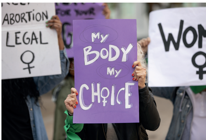
Figura 2.1. Algunas medidas concretas de sensibilización recogidas versan sobre campañas publicitarias y sobre la elaboración de guías y manuales de prevención de la violencia de género.