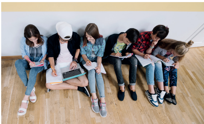
Figura 2.2. Los centros educativos han de ser espacios libres de violencia de género en los que se manifieste de manera explícita el rechazo hacia conductas discriminatorias y una intervención adecuada ante estas situaciones.

Por eso, en el ámbito educativo, trabajar desde la coeducación, la exigencia de materiales curriculares igualitarios, la detección de situaciones de violencia de género, la resolución de conflictos de forma pacífica, la corresponsabilidad y la erradicación de los estereotipos de género va a permitir ofrecer alternativas para la prevención de la violencia contra las mujeres.